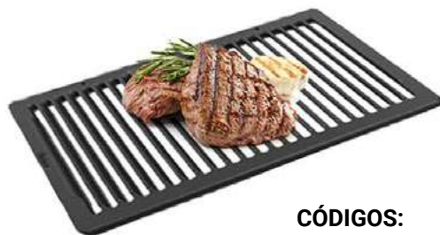
CÓDIGOS: 800466 - Chapa antiaderente Turbo Grill 800474 - Carregador de inox Turbo Grill