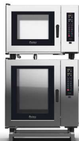
C-MAX 6 + C-MAX 10 ELÉCTRICOS