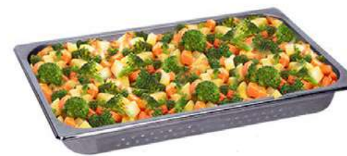
GN PERFORADA 65mm Verduras y hortalizas