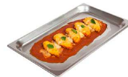
GN LISA 30mm Carnes, pastas, tartas y bizcochos

MAXIMICE LA EFICIENCIA DE LOS EQUIPOS Y LA CALIDAD DE SUS PLATOS.