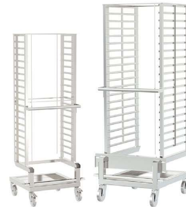
CARRO GAIOLA (C-MAX 20V e 40) Totalmente en acero inoxidable. Para los modelos C-MAX 20V Capacidad para 20 GN.