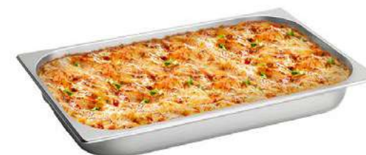
GN LISA 65mm Arroz, tartas, pastas, kibbes y lasañas