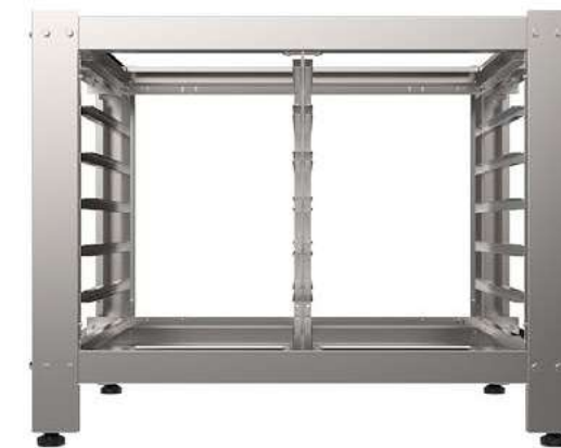
BASE DE APOYO (C-MAX 6, 10 e 20) Base totalmente en acero inoxidable con capacidad para 14 GN.