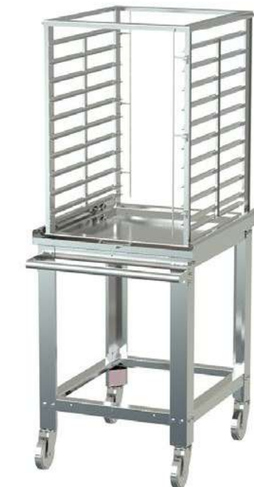
JAULA Y CARRO DE TRANSPORTE (C-MAX 20) Totalmente en acero inoxidable, con capacidad para 20 GN.