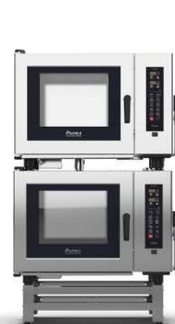
C-MAX 6 + C-MAX 6 ELÉCTRICOS

Ahorro y confort: optimice el uso del espacio en la cocina con equipos verticalizados.