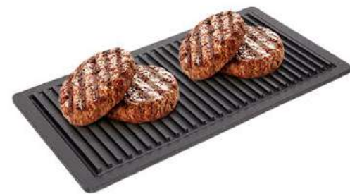
SMART GRILL Pescados, asados, verduras, esfirras y pizzas CÓDIGO: 800161