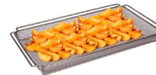
MALLA EXPANDIDA 45mm Papas fritas, yuca y deshidrataciones